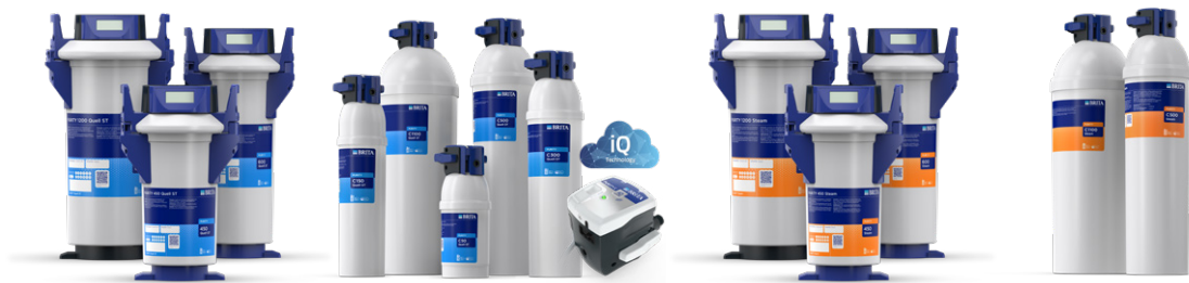
PURITY Quell ST PURITY C Quell ST / PURITY C iQ PURITY Steam PURITY C Steam

Hier sehen Sie das gesamte PURITY Filterportfolio speziell für leistungsstarkes Catering und Großküchen auf einen Blick. Unabhängig von den lokalen Wassergegebenheiten bietet BRITA Professional mit PURITY für nahezu alle Situationen die passende Produktlösung, die auch für Ihre Anwendung das optimale Wasser bereitstellt.